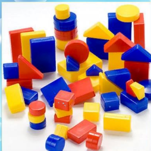
Карточки – образцы к блокам Дьенеша